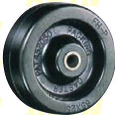
【차륜 재질】 페놀수지