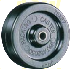
【차륜 재질】 페놀수지