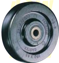
【차륜 재질】 페놀수지