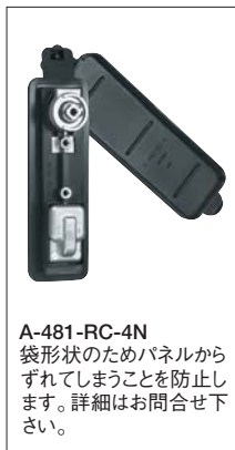
A-481-RC-4N 袋形状のためパネルからずれてしまうことを防止します。詳細はお問合せ下さい。