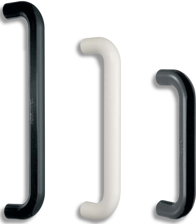
AP-42-C-1 ブラック Black