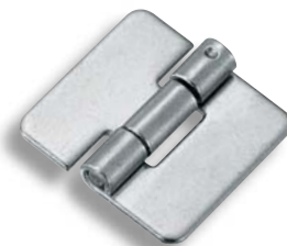
B-1137 穴なし Without hole