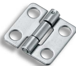
B-1137 穴あき With hole