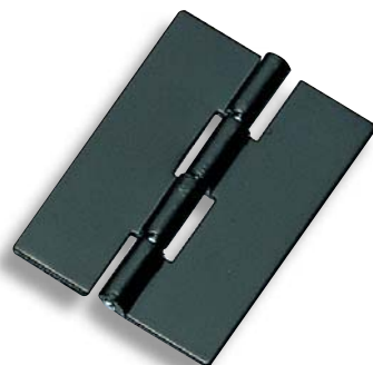
BP-106-A-1 黒 Black

Remarks ● Some part of dimensions has been changed.