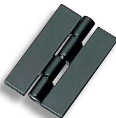
BP-106-A-2 黒 Black