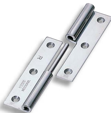
B-1004-1-R (ステンレス製の標準は穴あきです) Standard of stainless steel-made is supplied with hole.