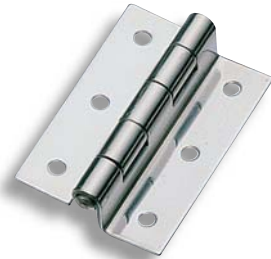
B-1028-1 (穴あき) With holes