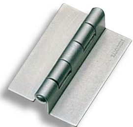
B-28-1 (穴なし) Without hole