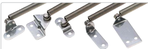
B-1221-A B-1221-B B-1221-C B-1221-D B-1221-E

● The product must not be used for a heavy object as a balance