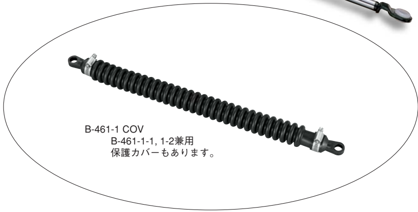
B-461-1 COV B-461-1-1, 1-2兼用 保護カバーもあります。