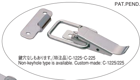
鍵穴なしもあります。(特注品)C-1225-C-225 Non-keyhole type is available. Custom-made: C-1225/225