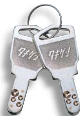
キーNo. D001 Key