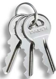
鍵違い key differences