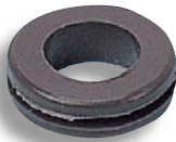
標準色は黒です。 Standard color: Black