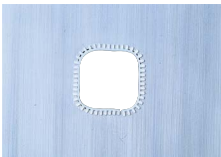
ポリアミド製自在グロメットもあります。 あらゆる穴形状に対応できます。 Polyamide-made adjustable grommets are available.