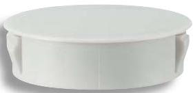
CP-30-HP-16 ダークアイボリー Dark Ivory